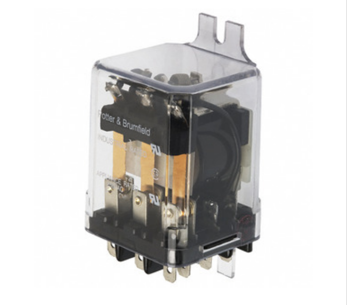
රූපය නිරූපණය විය හැකිය. නිෂ්පාදන විස්තර සඳහා පිරිවිතර බලන්න.

KUP-14AT5-24 Agastat Relays / TE Connectivity RELAY GEN PURPOSE 3PDT 10A 24V KUP-14AT5-24.pdf Lead / RoHS අනුකූල වේ 3884 pcs stock භාග්‍යකොටස DHL/Fedex/TNT/UPS/EMS