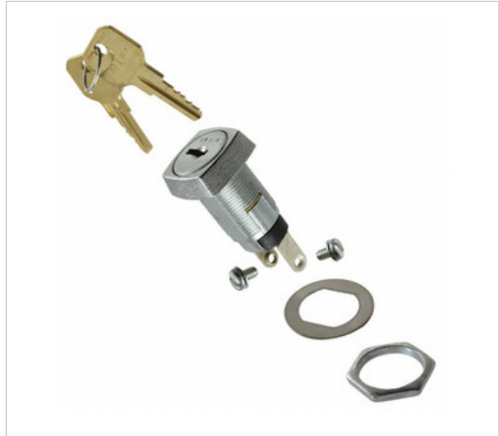
රූපය නිරූපණය විය හැකිය. නිෂ්පාදන විස්තර සඳහා පිරිවිතර බලන්න.