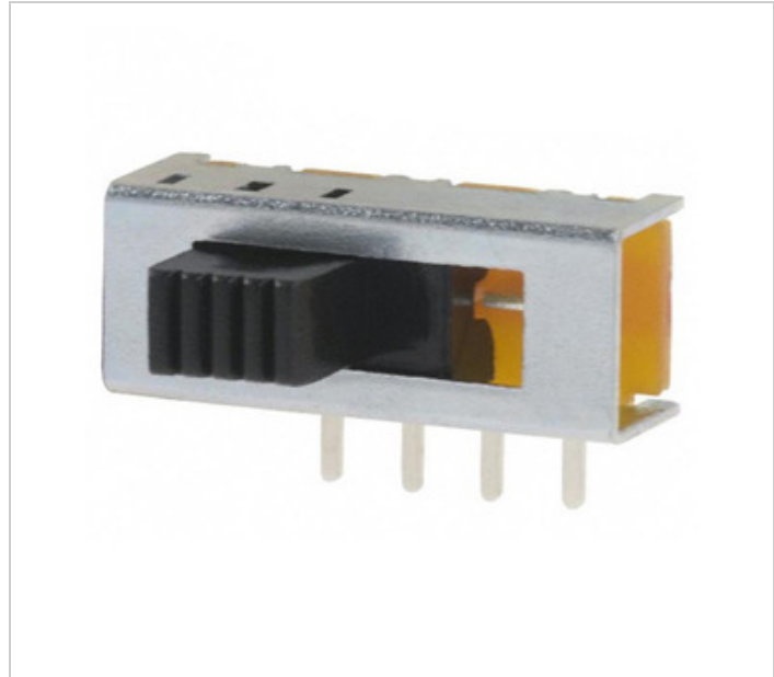
රූපය නිරූපණය විය හැකිය. නිෂ්පාදන විස්තර සඳහා පිරිවිතර බලන්න.

1825160-2 Agastat Relays / TE Connectivity SWITCH SLIDE SP3T 300MA 125V 1825160-2.pdf හොම්ලේ / RoHS අනුකූල වීම 43890 pcs stock භොංකොං DHL/Fedex/TNT/UPS/EMS