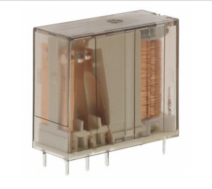
රූපය නිරූපණය විය හැකිය. නිෂ්පාදන විස්තර සඳහා පිරිවිතර බලන්න.

RP440024 Agastat Relays / TE Connectivity RELAY GEN PURPOSE DPST 8A 24V RP440024.pdf Lead / RoHS අනුකූල වේ 13914 pcs stock හොංකොං DHL/Fedex/TNT/UPS/EMS